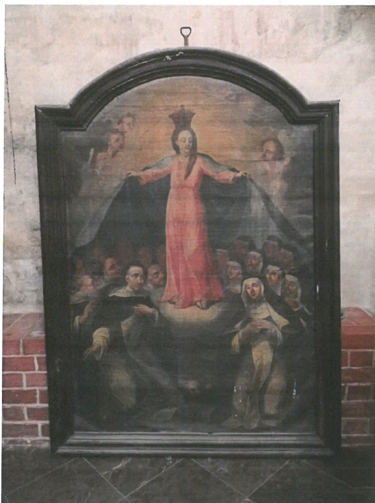
1. Lico obrazu